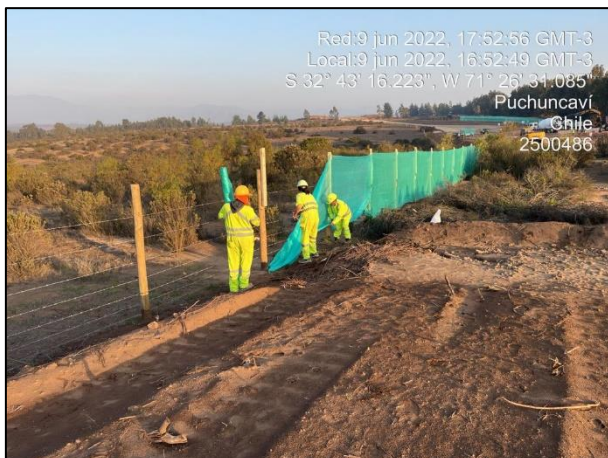
Figura 01: Postura de malla raschel en Sector 2 cercanos al punto 15 y 18 del Humedal Quirilluca.

Seguimiento fotográfico de la implementación de medidas de mitigación ambiental referente al componente aire durante el desarrollo de las actividades constructivas.