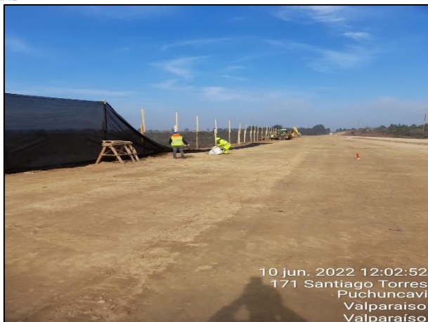
Figura 03: Postura de malla raschel en Sector 2 cercanos al punto 15 y 18 del Humedal Quirilluca.