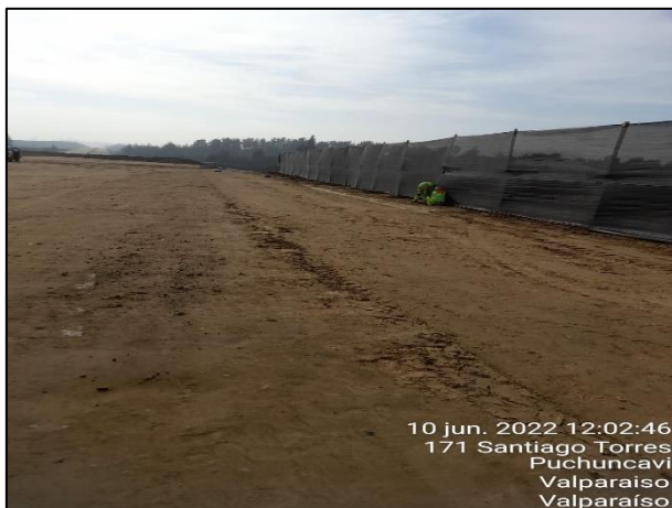
Figura 05: Postura de malla raschel en Sector 2 cercanos al punto 15 y 18 del Humedal Quirilluca.